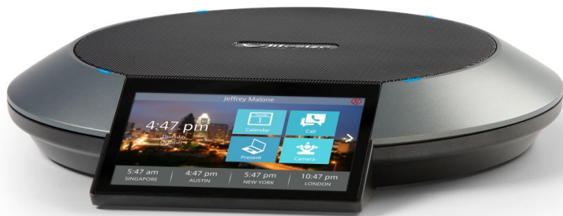
大きなディスプレイと使いやすいタッチスクリーンのインターフェイス